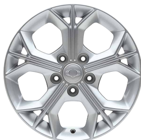
Jante aliaj 16" cu pneuri 205/65 R16