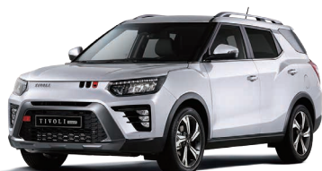
Alb GRAND (WAA)