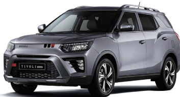
IRON metal (metalic) Argintiu (metalizat) (ADE)