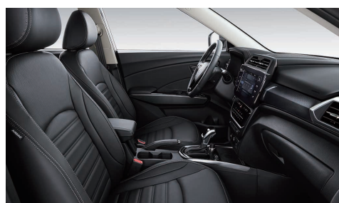
Interior negru (LBH)