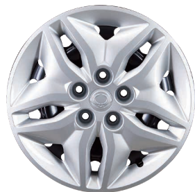
Jante oțel 16" cu pneuri 205/65 R16