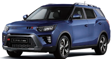
Albastru DANDY (metalizat) (BAS)