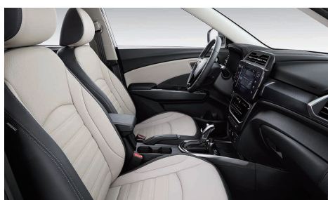
Interior gri (EBG)

Aceasta listă conține prețuri de vânzare maxime recomandate. Atenție: Informațiile prezentate în sistemele digitale de pe autovehicul, meniul calculatorului de bord sau meniul sistemului Audio-Video-Navigație pot fi disponibile în limba engleză dar sunt prezentate și explicate în limba română în Manualul Utilizatorului și în Manualul Sistemului de Infotainment (Smart Audio, AVN). AW Distribution Kft. nu își asumă răspunderea pentru eventualele greșeli de tipar sau ale listei de prețuri. AW Distribution Kft. își rezervă dreptul de a aduce modificări prezentei liste de prețuri, ca urmare a unor erori, modificări structurale sau de preț, aparute în urma unor comunicări din partea producătorului Ssangyong. Prețurile sunt exprimate în Euro și se vor calcula în lei la cursul din ziua plății. Pentru detalii ale promoțiilor vă rugăm să vă adresați partenerilor autorizați Ssangyong. Informațiile afișate în diferite puncte din autovehicul pot fi în limba engleză dar sunt prezentate și explicate și în limba română în Manualul Utilizatorului. Valabil începând din 1 august 2023 până la revocare.