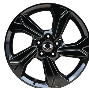
Jante aliaj 18" Diamond Cutting, negre, cu pneuri 215/50 R18

Aceasta lista contine preturi de vanzare maxime recomandate. Atentie: Informațiile prezentate în sistemele digitale de pe autovehicul, meniul calculatorului de bord sau meniul sistemului Audio-Video-Navigație pot fi disponibile în limba engleză dar sunt prezentate și explicate în limba română în Manualul Utilizatorului și în Manualul Sistemului de Infotainment (Smart Audio, AVN). AW Distribution Kft. nu își asumă răspunderea pentru eventualele greșeli de tipar sau ale listei de prețuri. AW Distribution Kft. își rezerva dreptul de a aduce modificări prezentei liste de prețuri, ca urmare a unor erori, modificări structurale sau de pret, aparute în urma unor comunicări din partea producătorului Ssangyong. Preturile sunt exprimate în Euro și se vor calcula în lei la cursul din ziua plății. Pentru detalii ale promoțiilor vă rugăm să vă adresați partenerilor autorizați Ssangyong. Informațiile afișate în diferite puncte din autovehicul pot fi în limba engleză dar sunt prezentate și explicate și în limba română în Manualul Utilizatorului. Valabil începând din 1 august 2023 până la revocare.