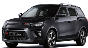
Negru SPACE (metalizat) (LAK)