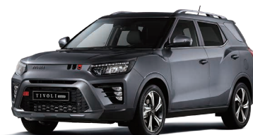
Gri PLATINUM GREY (metalizat) (ADA)