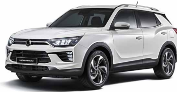
Alb Grand (WAA)