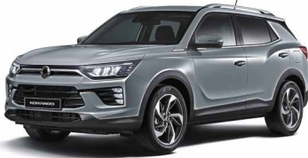
Gri Platinum (ADA)