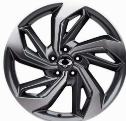
Jante aliaj 19" "Diamond Cutting" cu pneuri 235/50 R19