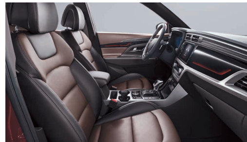
Interior maro (OAY)