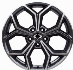
Jante aliaj 18" "Diamond Cutting" cu pneuri 235/55 R18