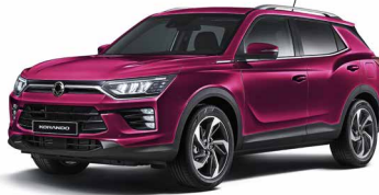
Roșu Cherry (RAV)