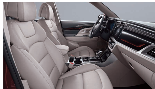
Interior gri (EBG)