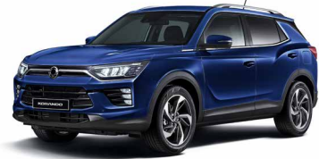
Albastru Dandy (BAS)