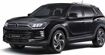
Negru Space (LAK)