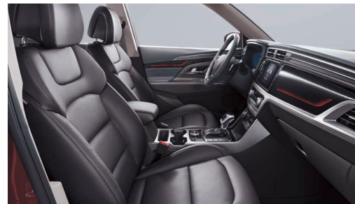
Interior negru (LBH)