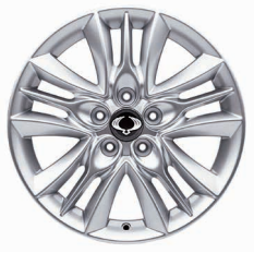
Jante aliaj 17" cu pneuri 225/60 R17