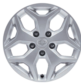
Jante aliaj 18" cu pneuri 255/60 R18