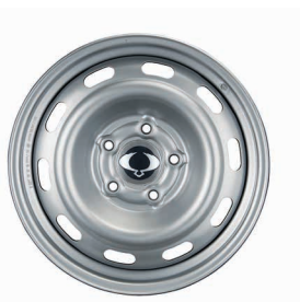
Jante oțel 17" cu pneuri 235/70 R17