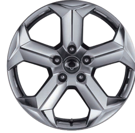
Jante aliaj 20" cu pneuri 255/50 R20