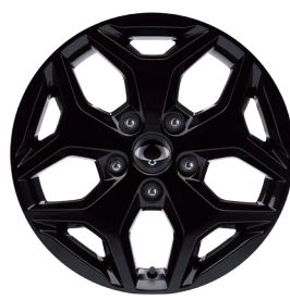
Jante aliaj 18" negre cu pneuri 255/60 R18