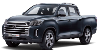
Gri antracit GALAXIES (metalizat) (ADB)