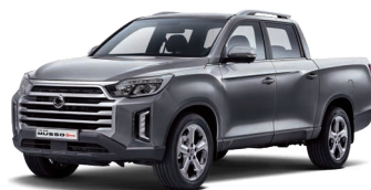
Gri MARBLE (metalizat) (ACM)