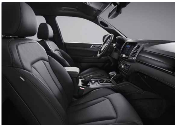
Tapiterie din piele neagră, plafon de culoare neagră (LBT2)