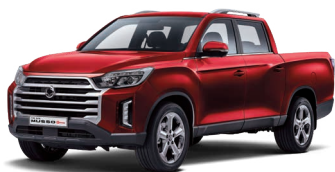
Roșu INDIAN (metalizat) (RAJ)