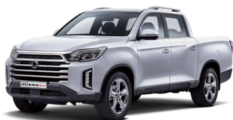
Alb perlat SILKY WHITE (sidefat) (WAK)