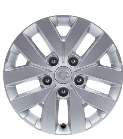
Jante aliaj 17" cu pneuri 235/70 R17