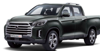
Verde AMAZONIA (metalizat) (GAM)