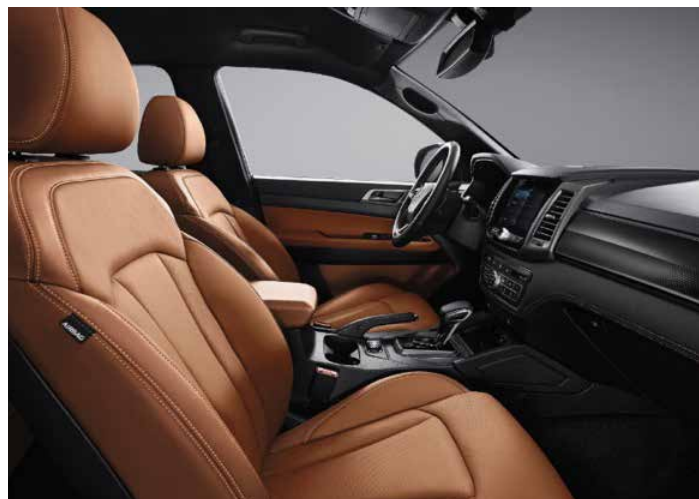
Tapiterie de piele maro, plafon de culoare neagră (OBA)